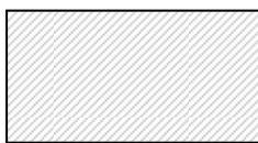
Figura 1. Banner 120x60 pixel

I Banner pubblicitari che saranno inseriti nelle pagine del sito Internet del Comune di Fiano Romano hanno dimensione standard di 120x60 pixel, come mostrato in Figura 1.