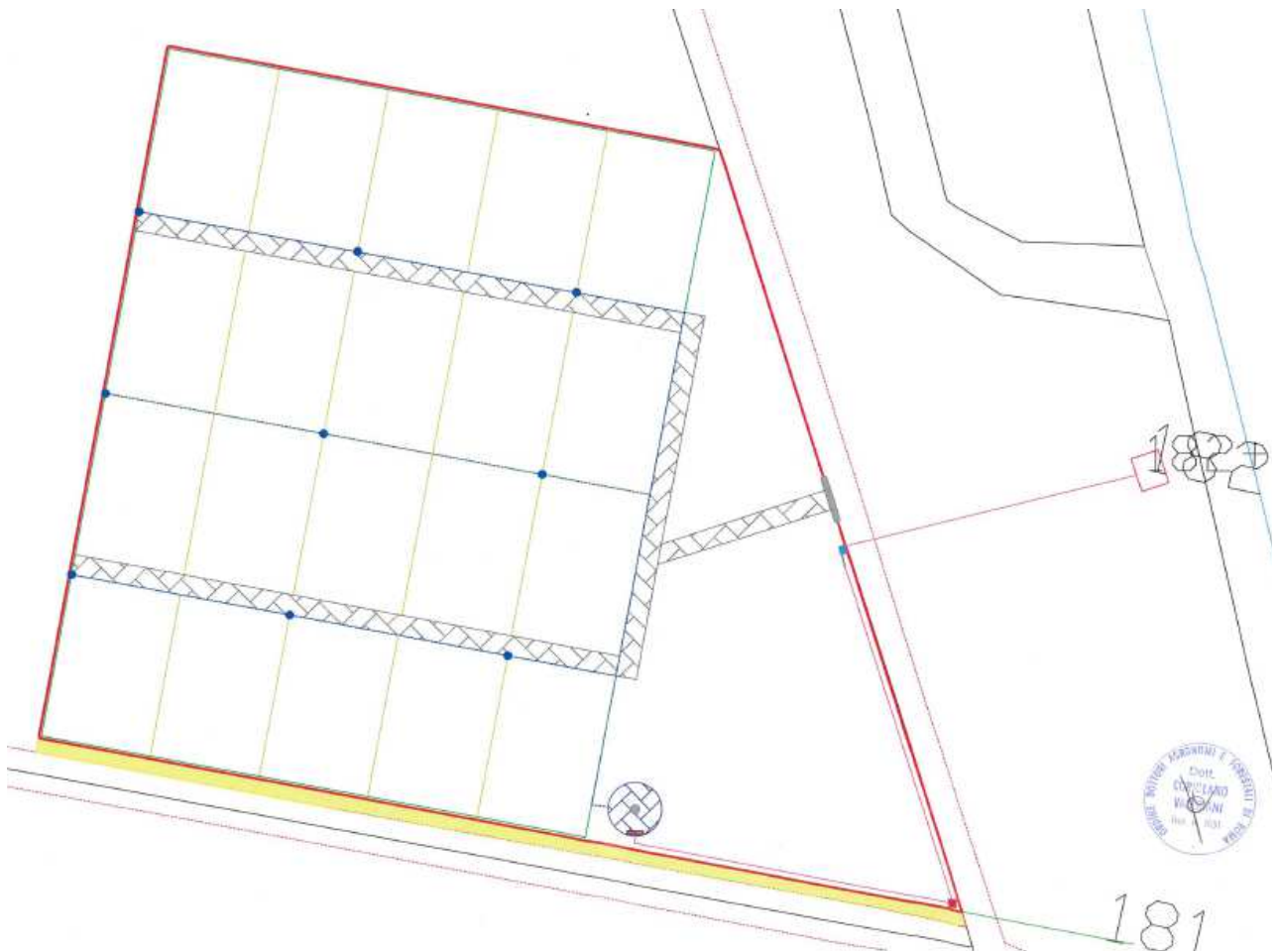
Rappresentazione schematica dell'appezzamento suddiviso in lotti