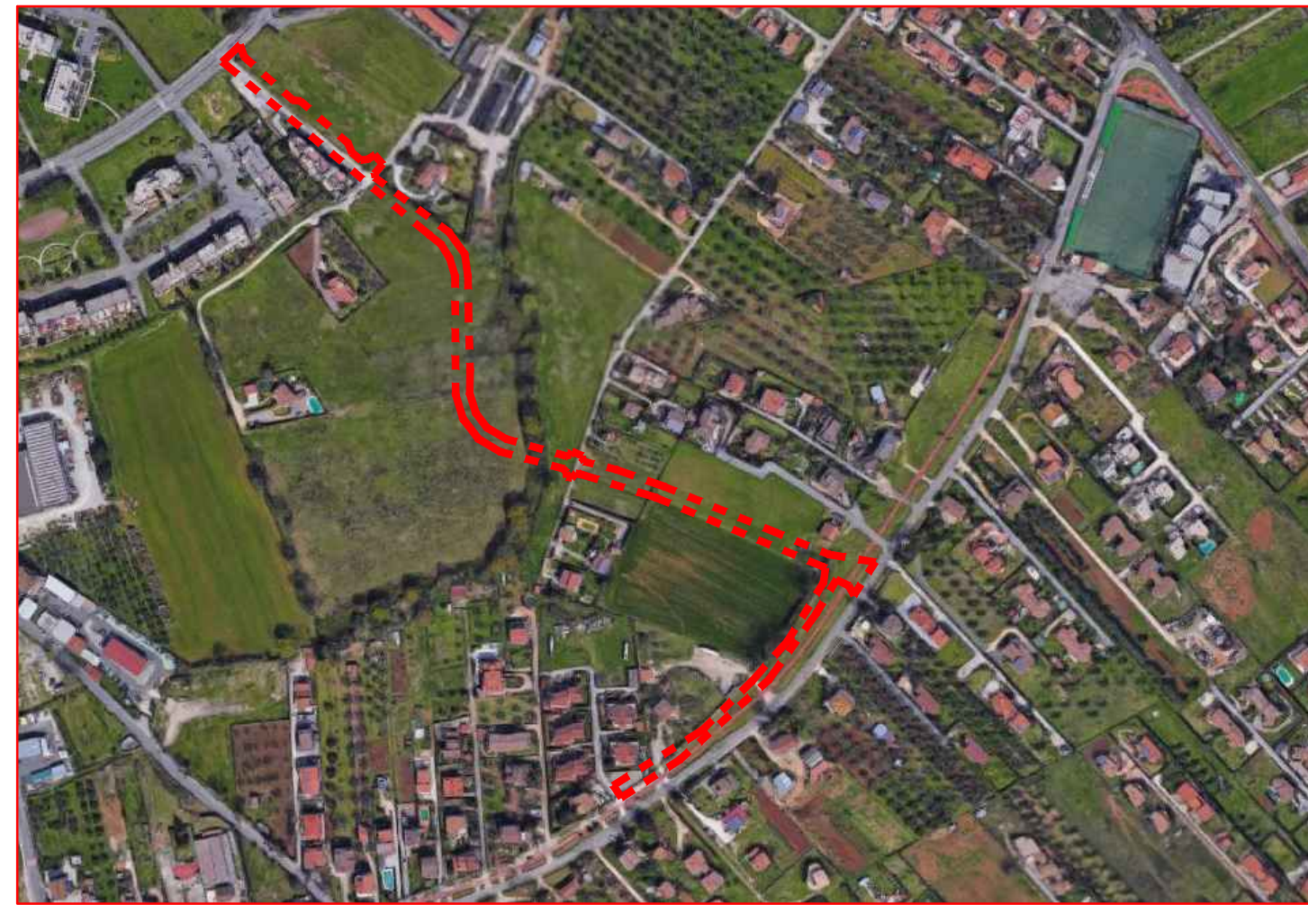
IMMAGINE AREA D'INTERVENTO

TAVOLE: SCALA: DATA: RISERVATO UFFICIO: 0 05/07/2022