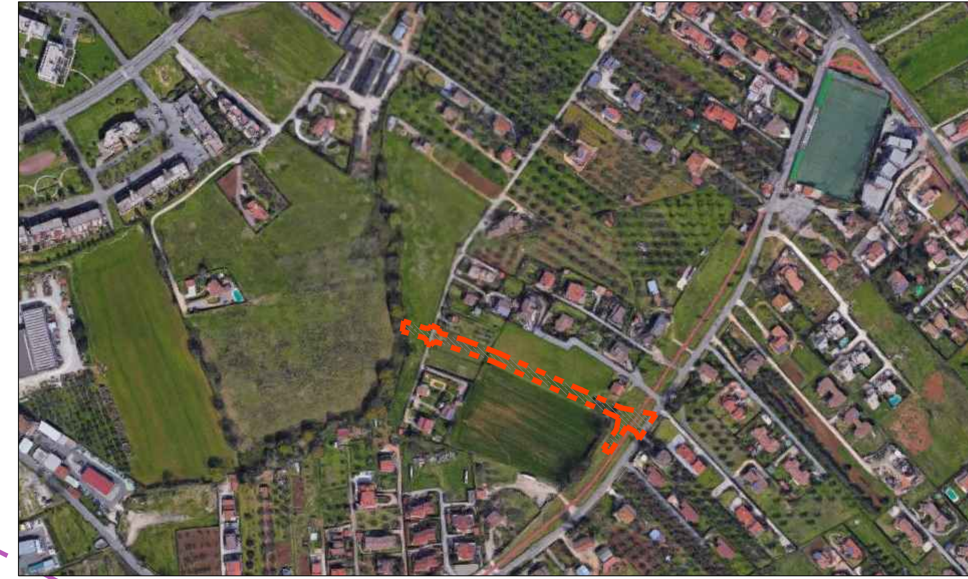
IMMAGINE AREA D'INTERVENTO